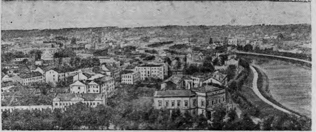
г. Вильнюс (Вильно).